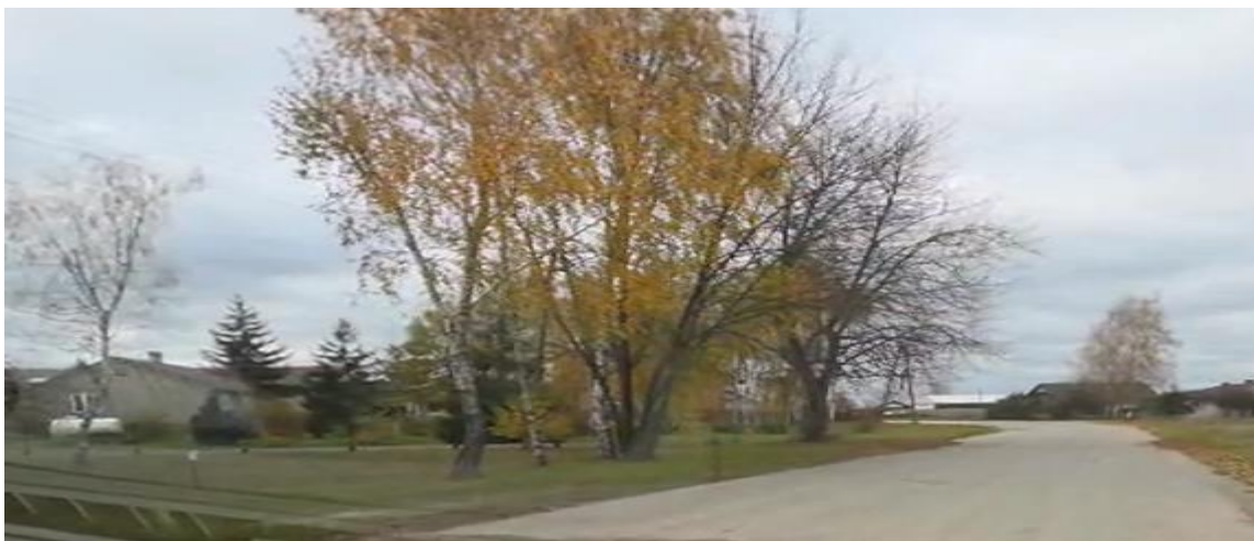
Zdjęcie nr 1. Widok na istniejącą drogę gminną w m. Sitnik, początek odcinka 1a.

Projektowana inwestycja wpłynie na poprawę dostępności do przyległych działek.